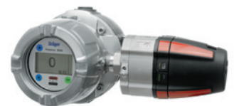
Dräger Polytron 8700 с присоединенной распределительной коробкой e-Box: версия с проводкой повышенной безопасности.