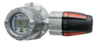
Dräger Polytron 8700 Взрывозащищенная измерительная головка для контроля горючих газов